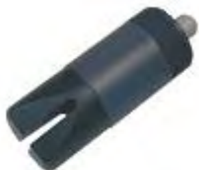
Sensore standard M-15 Alte Concentrazioni

Tutti i sensori InsitelG hanno un fitting con collegamento rapido da 1/4" che può essere collegato ad una linea di alimentazione di aria o acqua compressa. Il controllore dell'analizzatore può comandare direttamente una valvola a solenoide, ad intervalli selezionabili inserendo aria o acqua compressa se essa è disponibile sull'impianto, per effettuare una autopulizia della sonda, pulendola periodicamente da eventuale accumulo di fanghi sul sensore. Se necessario è possibile installare un apposito compressore se l'aria compressa di linea non è disponibile.