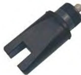
Sensore M-15L Basse Concentrazioni